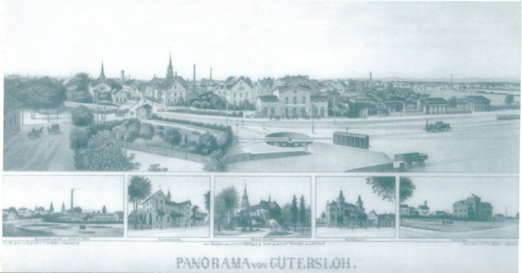
PANORAMA VON GÜTERSLOH.

humil' marit. Hocu' sit a'ly. ap' fidelib' q'd d'ns L'vdoll' in cu' hereditate y mundalib' s' l'ra. et ratio. i' d'ct' d'ct' mā in gub'ns'lo not' reh. ad subd'ct' d'ct' d'ct' d'ct' nabil' acta. banni n'ri aurobezzum. d'no d'ct' d'ct'one u. T'ct' d'ct' capellan' d'ni d'ct'.