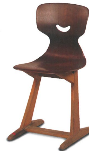
Der Formsitz von Flötotto – seit 1952 wurden über 21 Millionen Stück verkauft. Foto: Flötotto