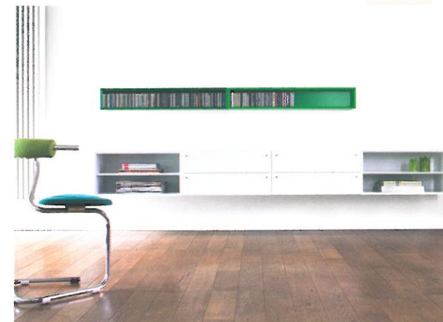
Seit 2010 erhältlich – das flexible Möbelsystem Quaro Foto: Flötotto

Flötotto ist jedoch mehr als nur ein bekannter Möbelhersteller aus Gütersloh. Was viele nicht wissen: Zur Flötotto Interior Group gehören die Unternehmen Authentics und Sitting Bull. Authentics stellt praktische und schöne Accessoires zum Reisen, Wohnen und Arbeiten her; Sitting Bull ist Marktführer im Segment hochwertiger Sitzsäcke und Sitzmöbel.